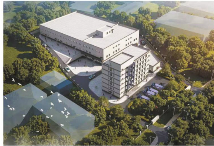
抚顺市盛益屠宰加工有限公司项目鸟瞰图