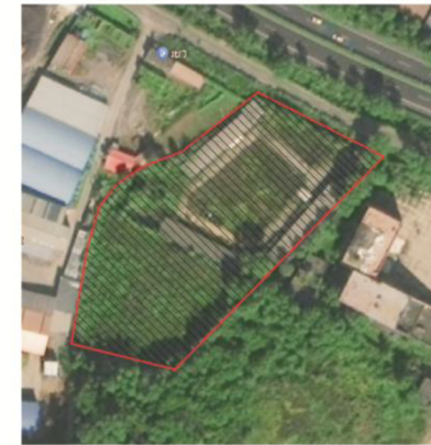
抚顺市盛益屠宰加工有限公司项目区位图