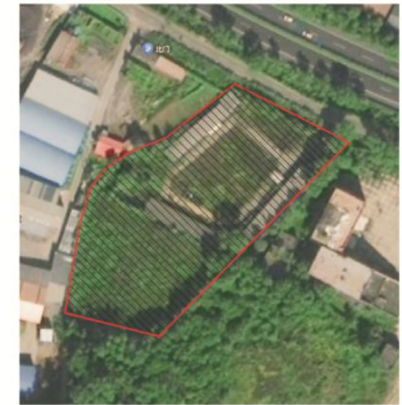
抚顺市盛益屠宰加工有限公司项目区位图