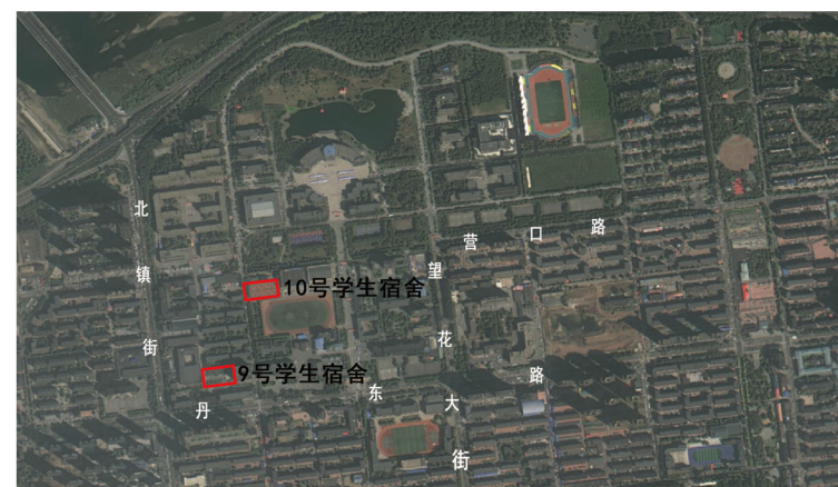
9号、10号学生宿舍新建项目区位图