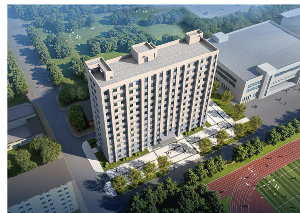
10号学生宿舍新建项目鸟瞰图