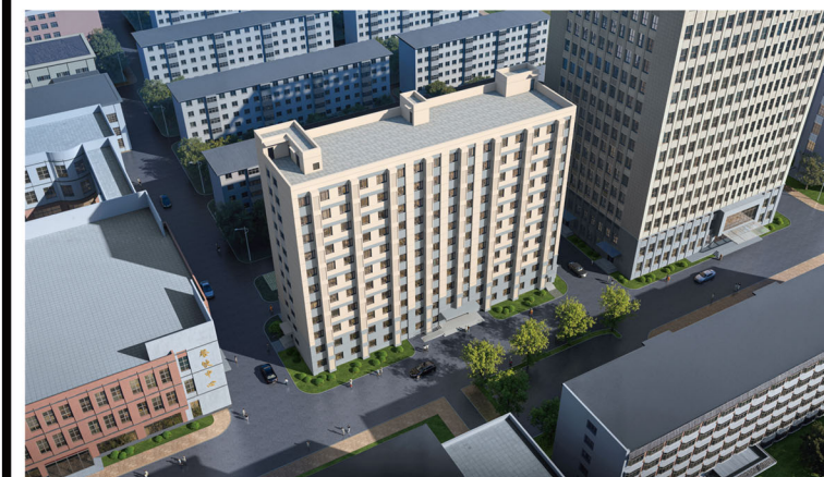
9号学生宿舍新建项目鸟瞰图