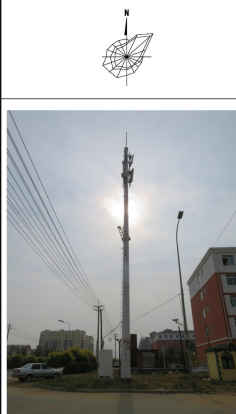
建议采用灯杆景观塔形式，三方运营商公用。