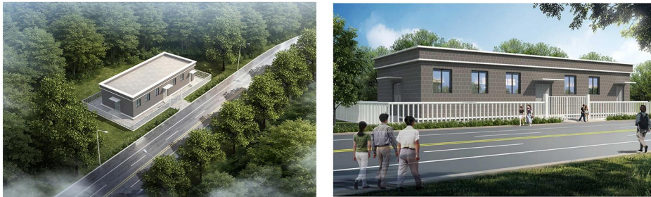
辽宁石油化工大学电力增容改造项目新建10KV开关站鸟瞰图、立面图